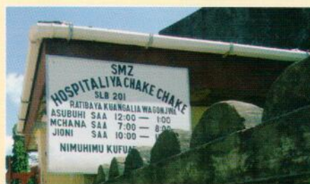
Sehemu ya jengo la Hospitali ya Chake Chake, Pemba alipopelekwa mtoto mchanga aliyekatwa pua na kufariki.