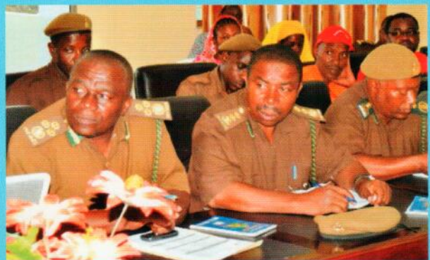
Baadhi ya Maafisa wa Chuo cha Mafunzo Zanzibar wakiwa makini kumsikiliza mtoa mada katika kuipitia na kuichangia Rasimu ya Sheria ya Chuo cha Mafunzo Zanzibar, katika Ukumbi wa Chuo hicho.

Mkutano huo ulikuwa ni wa siku mbili ambapo ulifanyika Unguja na Pemba, tarehe 20-21 Agosti kwa Unguja, na Inaendelea Uk. 3