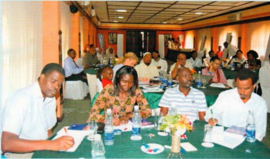
Baaadhi ya washiriki wakifuatilia mafunzo ya Malezi Salama kwa Watoto yaliyofanyika katika Ukumbi wa Zanzibar Beach Resort, Mazizini Zanzibar.