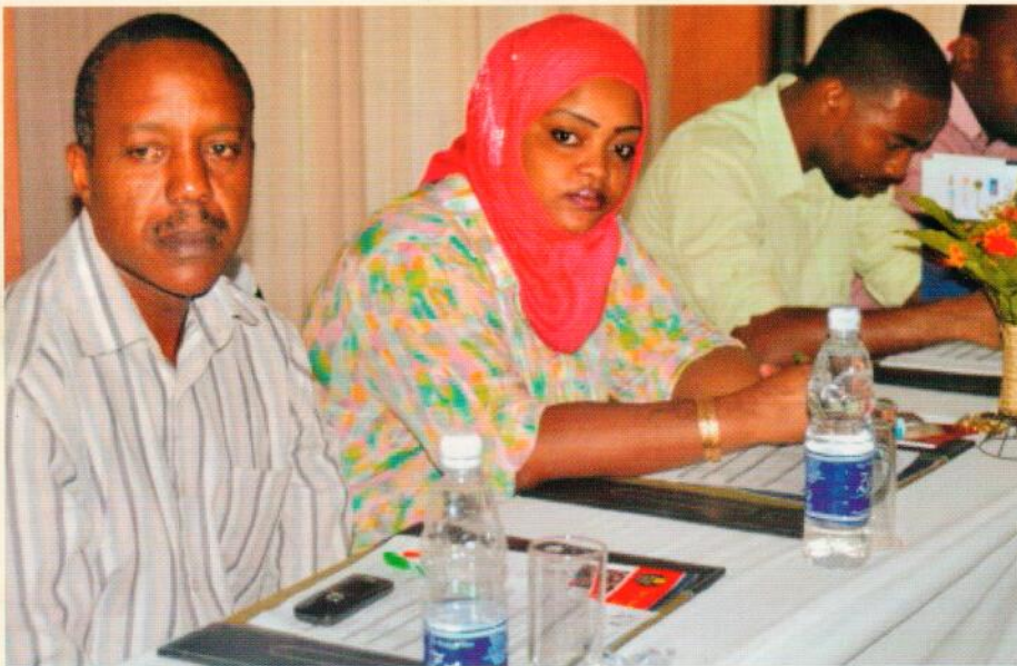
Baadhi ya mahakimu na wanasheria wa Serikali kutoka Afisi ya Mkurugenzi wa Mashtaka Zanzibar wakisikiliza mada inayowasilishwa kuhusu ulinzi wa Mtoto, Katika Ukumbi wa Zanzibar Beach Resort-mazirini Zanzibar tarehe 14 Septemba 2013.

K ITUO cha huduma za sheria Zanzibar ZLSC kikishirikiana na Shirika la Save the Children wameandaa mafunzo ya siku mbili kwa mahakimu, Waendesha mashtaka na madaktari Unguja na Pemba.