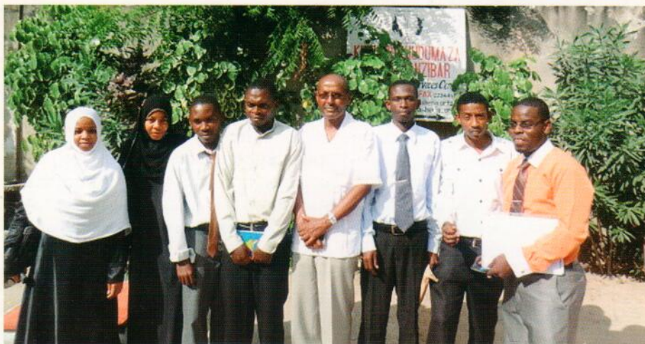
MHESHIMIWA Jaji wa Mahkama ya Kimataifa ya Haki (International Court of Justice) Abdulqawi Yussuf (katikati aliyevaa miwani) akipiga picha ya pamoja na baadhi ya wanafunzi wa Kitivo cha Sheria Cha Chuo Kikuu, Zanzibar; Tunguu nje ya Kituo cha Huduma za Sheria Zanzibar (ZLSC). Mheshimiwa Jaji alitembelea ZLSC na wanafunzi walikuwa wakihudhuria mafunzo ya vitendo.