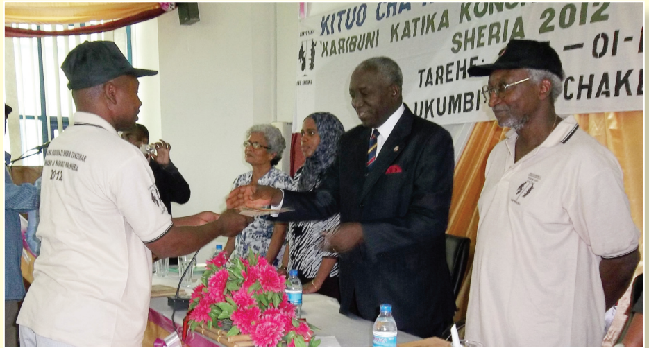
Jaji Mkuu Mstaafu wa Tanzania Mheshimiwa Barnabas Samatta akimkabidhi mmoja wa Wasaidizi wa Sheria wahitimu Disemba 01, 2012 katika mahafali iliyofanyika sambamba na kongamano la Wasaidizi wa Sheria katika Ukumbi wa Zanzibar Social Security Fund, Tibirinzi, Pemba.

Mahafali yalifanyika sambamba na kongamano la wasaidizi wa sheria lililofanyika katika ukumbi wa Zanzibar Social Security Fund (ZSSF).