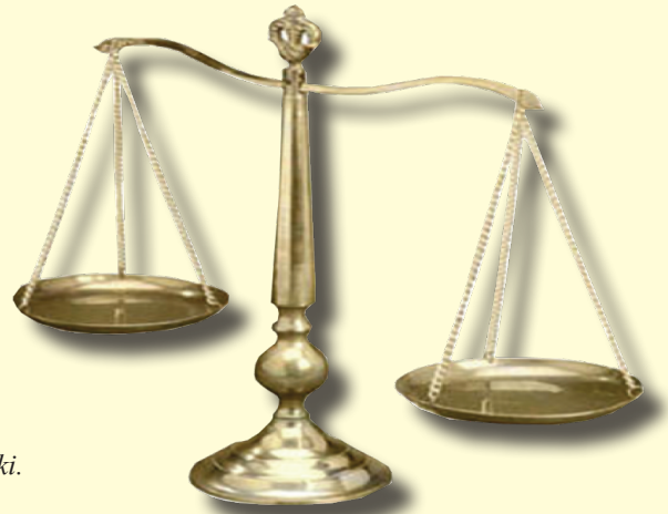
Mezani ya Haki.

Siku ya kwanza ya kesi mbele ya Mahkama, mshtakiwa lazima asomewa