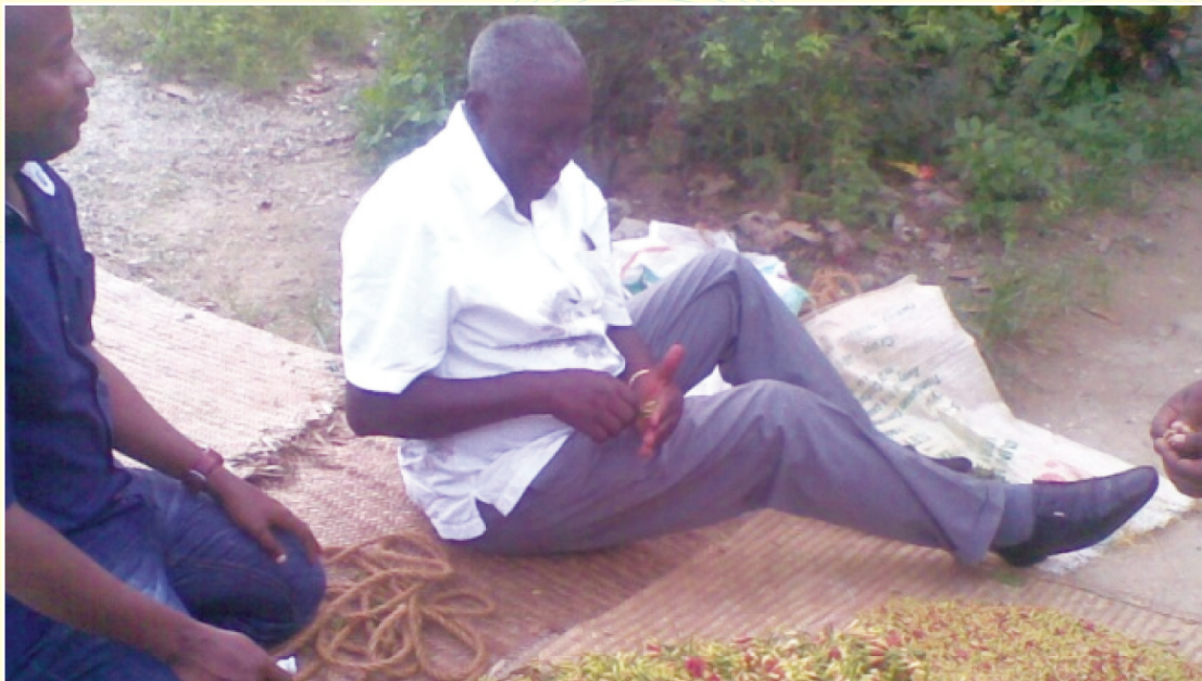
Jaji Mkuu Mstaafu wa Tanzania Mheshimiwa Barnabas Samatta akichambua Karafuu Pemba. Jaji Samatta alikuwepo Pemba kushiriki kongamano la Wasaidizi wa Sheria lililotayarishwa na Kituo cha Huduma za Sheria Zanzibar (ZLSC) Novemba 30, 2012.