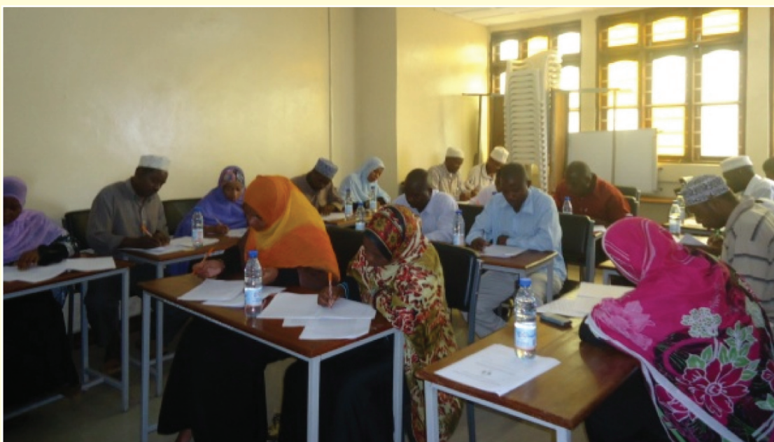
Baadhi ya Wasaidizi wa Sheria wakifanya mitihani ya mwisho wa mwaka wa kwanza wa masomo ya msingi ya Sheria Disemba 22-23, 2012, katika Ukumbi wa Kituo cha Huduma za Sheria Chake Chake Pemba, Zanzibar.