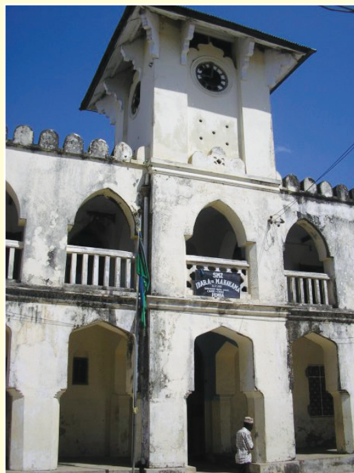
Jengo la Mahakama ya Chake Chake Pemba

Hati ya mashtaka ni dira na msingi katika kesi ya jinai. Hati ya mashtaka hueleza kosa na muhtasari wa kosa. Hati ya mashtaka inatoa mwanga upande wa utetezi kujiandaa dhidi ya kosa.