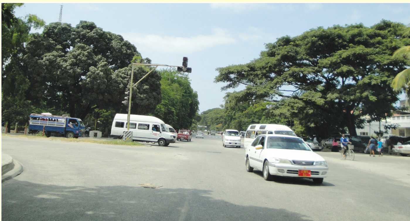
Taa za kuongozea vyombo vya barabarani pamoja na watumiaji wa barabara zilizopo Mwanazini Zanzibar ambazo zimeharibika kwa muda mrefu sasa bila ya kuonekana jitihada za kuzikarabati

Sheria ya Usalama Barabarani iheshimiwe ili kupunguza ajali zinazoepukika. Utaratibu wa kutoa leseni uboreshwe ili kuziba mwanya kutoa leseni holela.