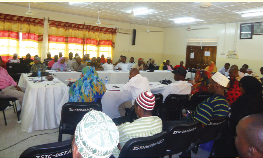
Baadhi ya Wasaidizi wa Sheria, wakiwa katika mafunzo ya uundaji wa Jumuiya yaliyofadhiliwa na Shirika la Legal Services Facility (LSF) na kufanyika Disemba 03-04, 2012, katika Ukumbi wa Makonyo, Wawi, Pemba.

W ASAIKIZI wa Sheria wamehudhuria semina ya siku mbili ya kujadili mbinu za kuunda mtandao ( Zanzibar Paralegals Network ) kuendeleza kazi zao watakapomaliza mafunzo ya miaka miwili ya elimu ya msingi ya sheria.